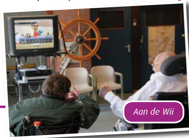
Aan de Wii